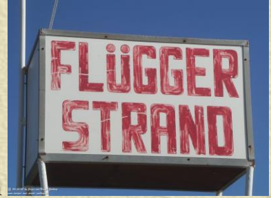
Wir starten am 11.03.2020 am